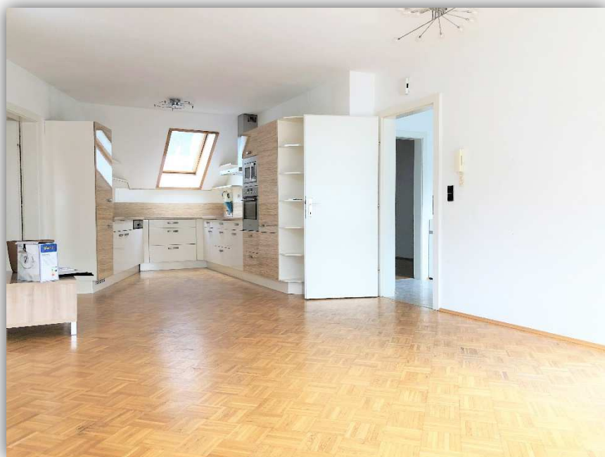
4: WOHN-ESS BEREICH

STYRIAN HOMES ® SEIFERT IMMOBILIEN GMBH INNERHOFERSTRASSE 39 8045 GRAZ FN: 507676H UID: ATU74173208