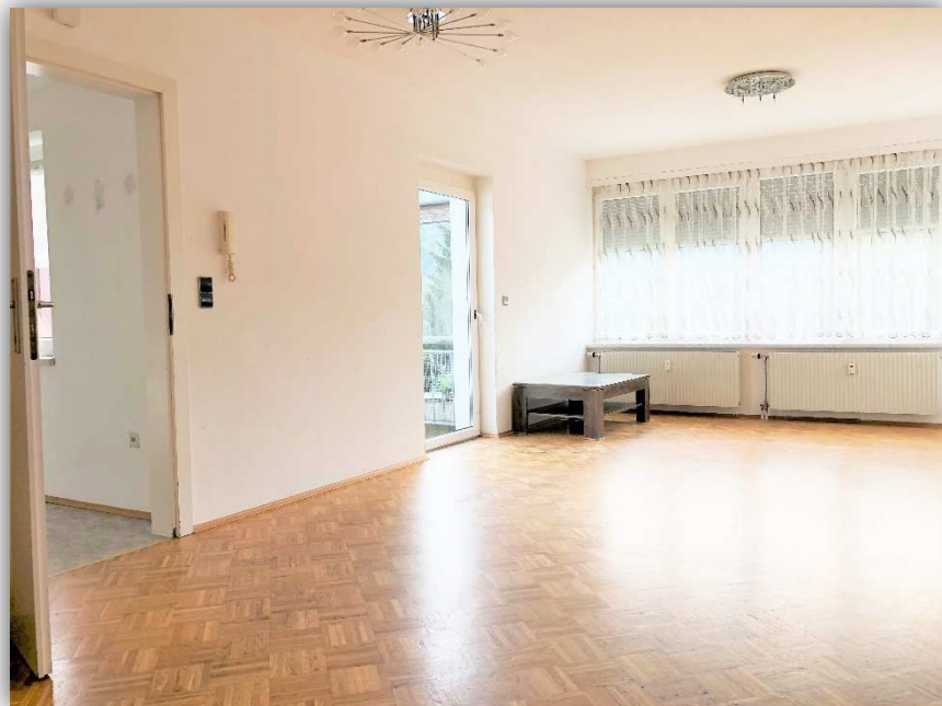
2: WOHNZIMMER MIT ZUGANG AUF TERRASSE

STYRIAN HOMES ® SEIFERT IMMOBILIEN GMBH INNERHOFERSTRASSE 39 8045 GRAZ FN: 507676H UID: ATU74173208